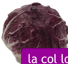
la col lombarda

una ración de cubre el 100% de la cantidad diaria recomendada de vitamina C .